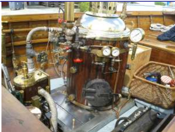
La belle machine à vapeur de Lady Julie avant sa prestation sur la Seine.