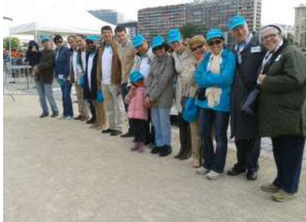
Une équipe complète d'Axa Atout Cœur a assuré le mécénat et l'accueil des handicapés de plusieurs associations : Grand Chemin, Perce Neige et Maison Handicap Darty.