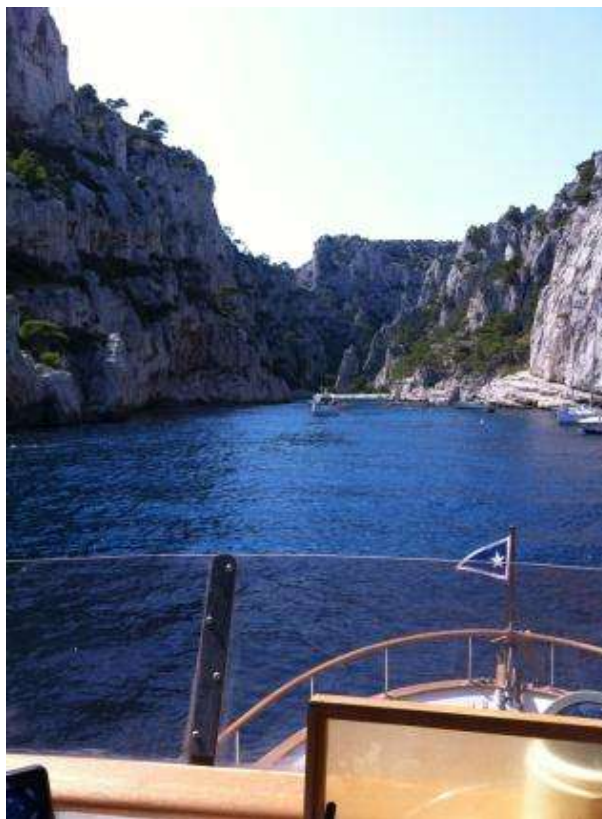
Diwandema II à En-vau.

Roscoff-Bloscon), Aber Benoit et retour sur Ouistreham.