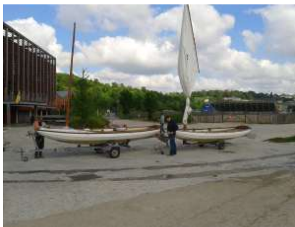
Les premiers Seils sont gréés et mis à l'eau