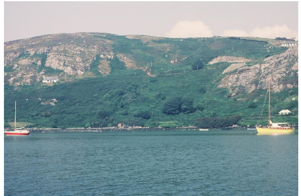
Mouillage isolé derrière ROW Rock, dans 2,5 m d'eau.

Rocher du FASTNET d'un côté, le mont GABRIEL et ses deux petits radômes de l'autre, les îles CALF, LONG et GOAT se succèdent avant notre entrée de nuit dans le petit fjord de CROOKHAVEN.